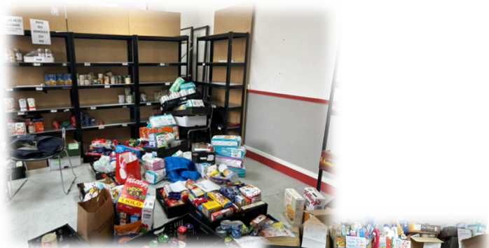
Les paniers du moulin

Merci pour toutes vos belles boîtes cadeaux Dédiées aux bénéficiaires de notre Entraide !!