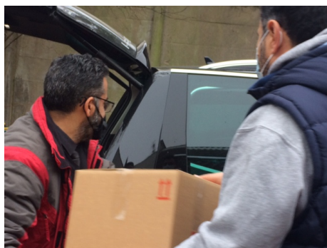
Photos du chargement des cadeaux collectés à Noël