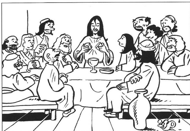
La sainte cène