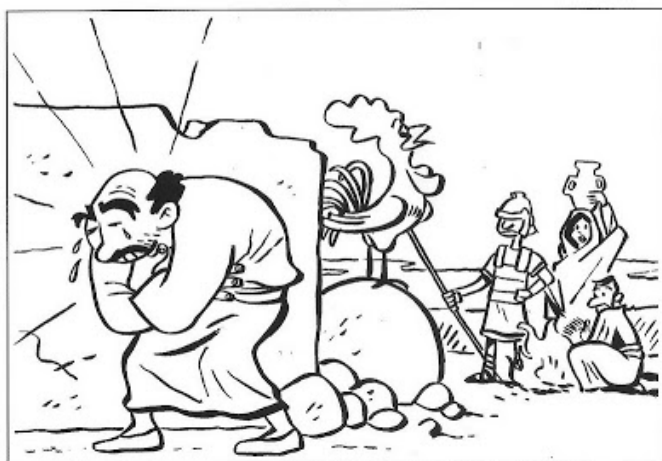
Pierre renie Jésus