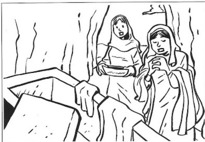
Jésus est ressuscité !!

Tu peux aussi regarder dans une bible si tu trouves les références dans les évangiles !