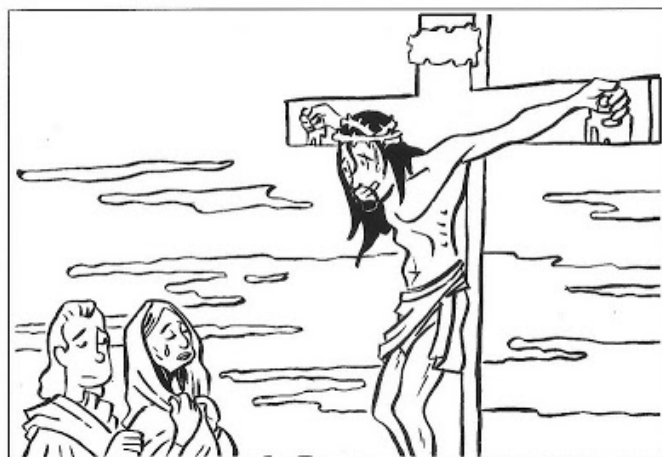
Jésus est crucifié

Tu peux aussi regarder dans une bible si tu trouves les références dans les évangiles !