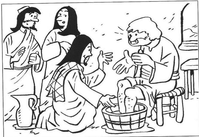
Jésus lave les pieds de ses disciples